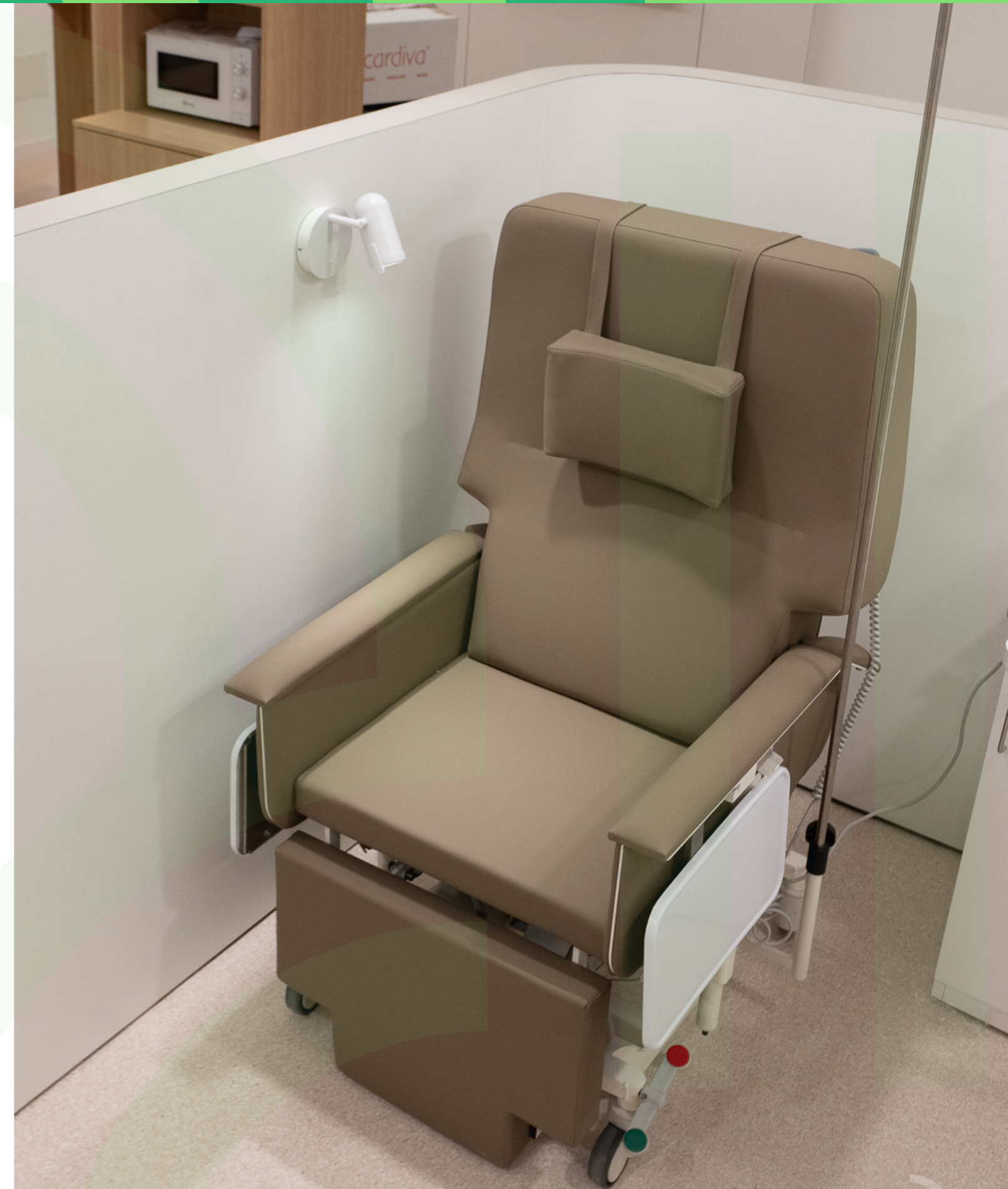
Obres de l'any: Unitat de Dolor (planta 1 a pavelló 1)

https://www.clinicbarcelona.org/ca/noticies/nou-projecte-per-millorar-al-diagnostic-del-cancer-colorectal-mitjancant-intel-ligencia-artificial