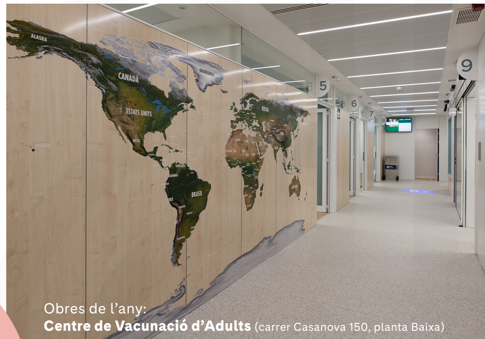
Obres de l'any: Centre de Vacunació d'Adults (carrer Casanova 150, planta Baixa)

https://www.clinicbarcelona.org/ca/noticies/completat-el-mapa-genomic-de-la-leucemia-linfatica-cronica