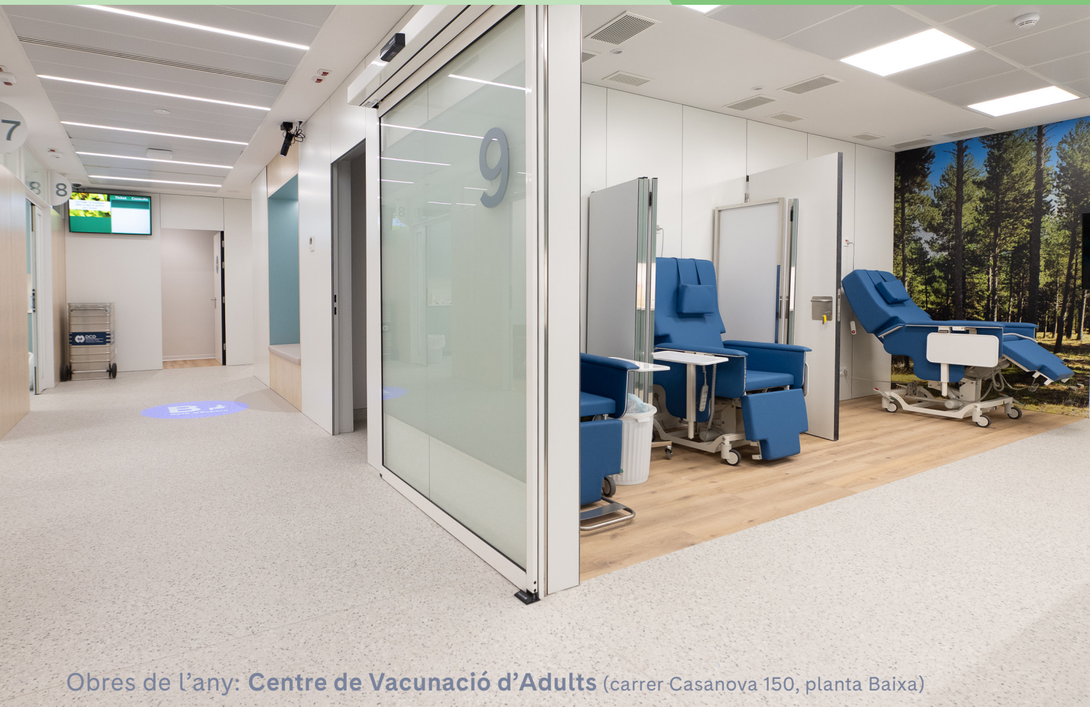
Obres de l'any: Centre de Vacunació d'Adults (carrer Casanova 150, planta Baixa)