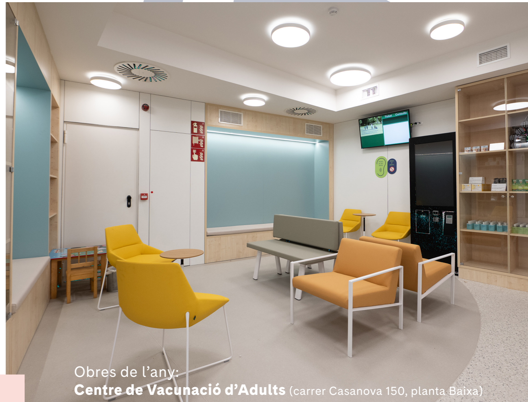
Obres de l'any: Centre de Vacunació d'Adults (carrer Casanova 150, planta Baixa)

https://www.clinicbarcelona.org/ca/noticies/la-prescripcio-infermera-una-realitat-a-lhospital-clinic