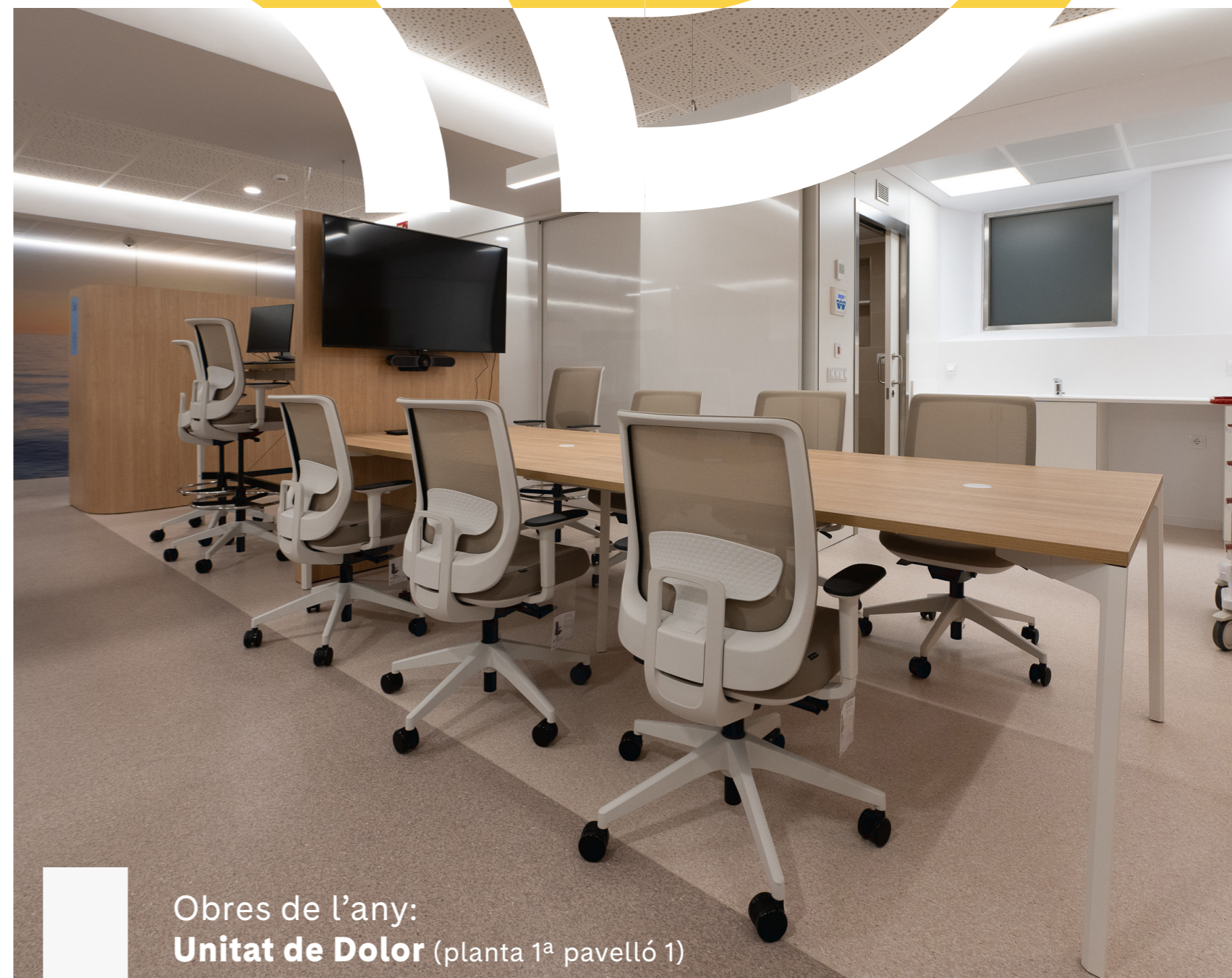
Obres de l'any: Unitat de Dolor (planta 1 a pavelló 1)

https://www.clinicbarcelona.org/noticias/tecnicas-de-emergencia-vital-la-simulacion-es-vital